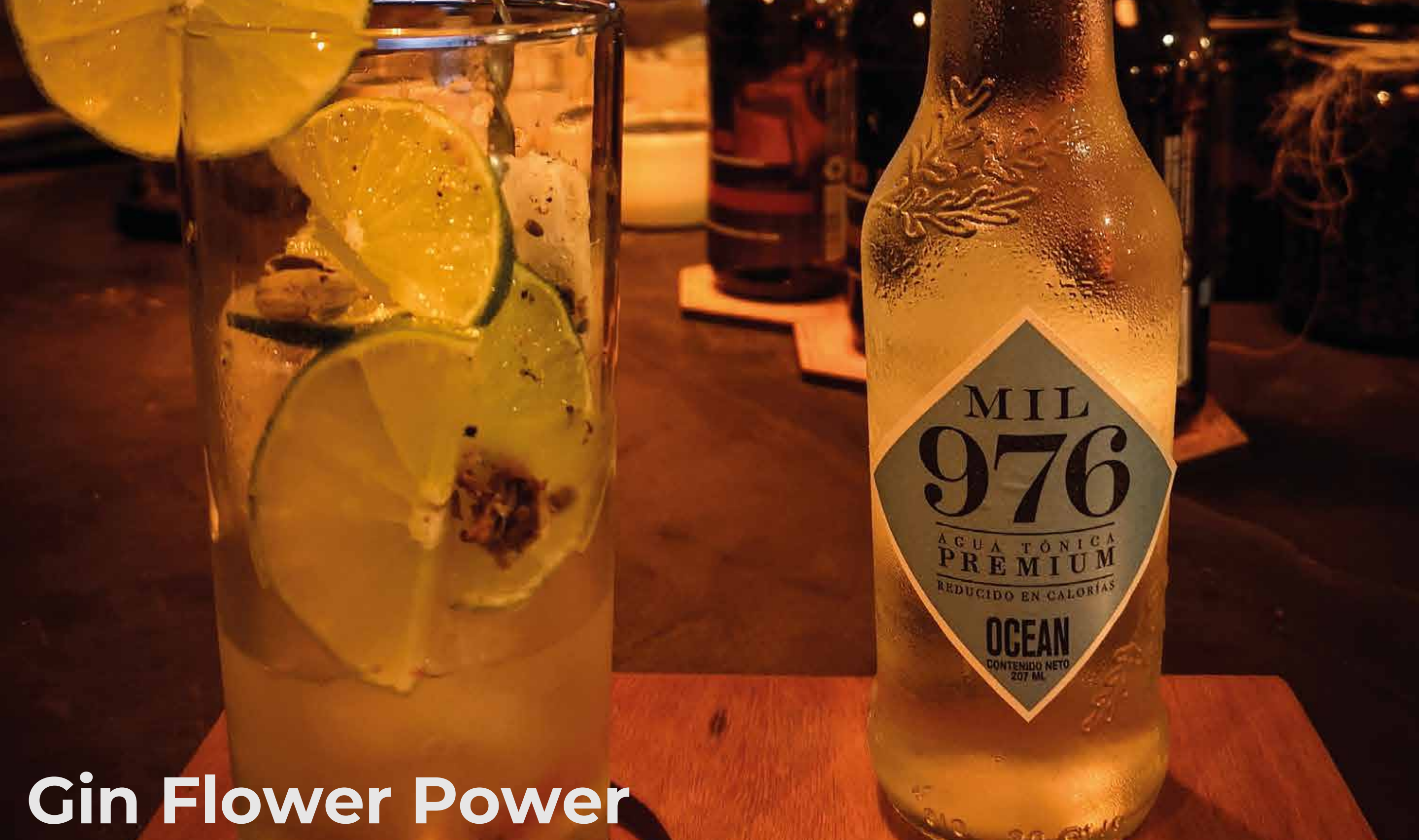
Gin Flower Power