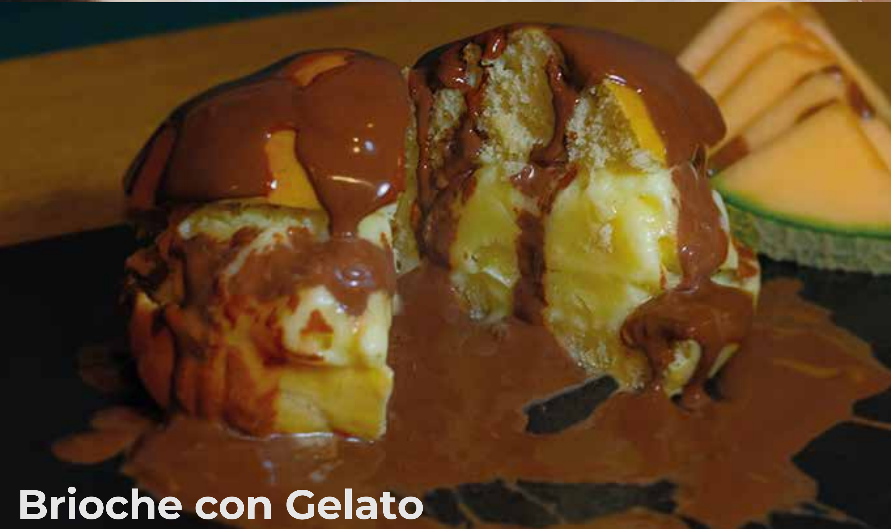
Brioche con Gelato