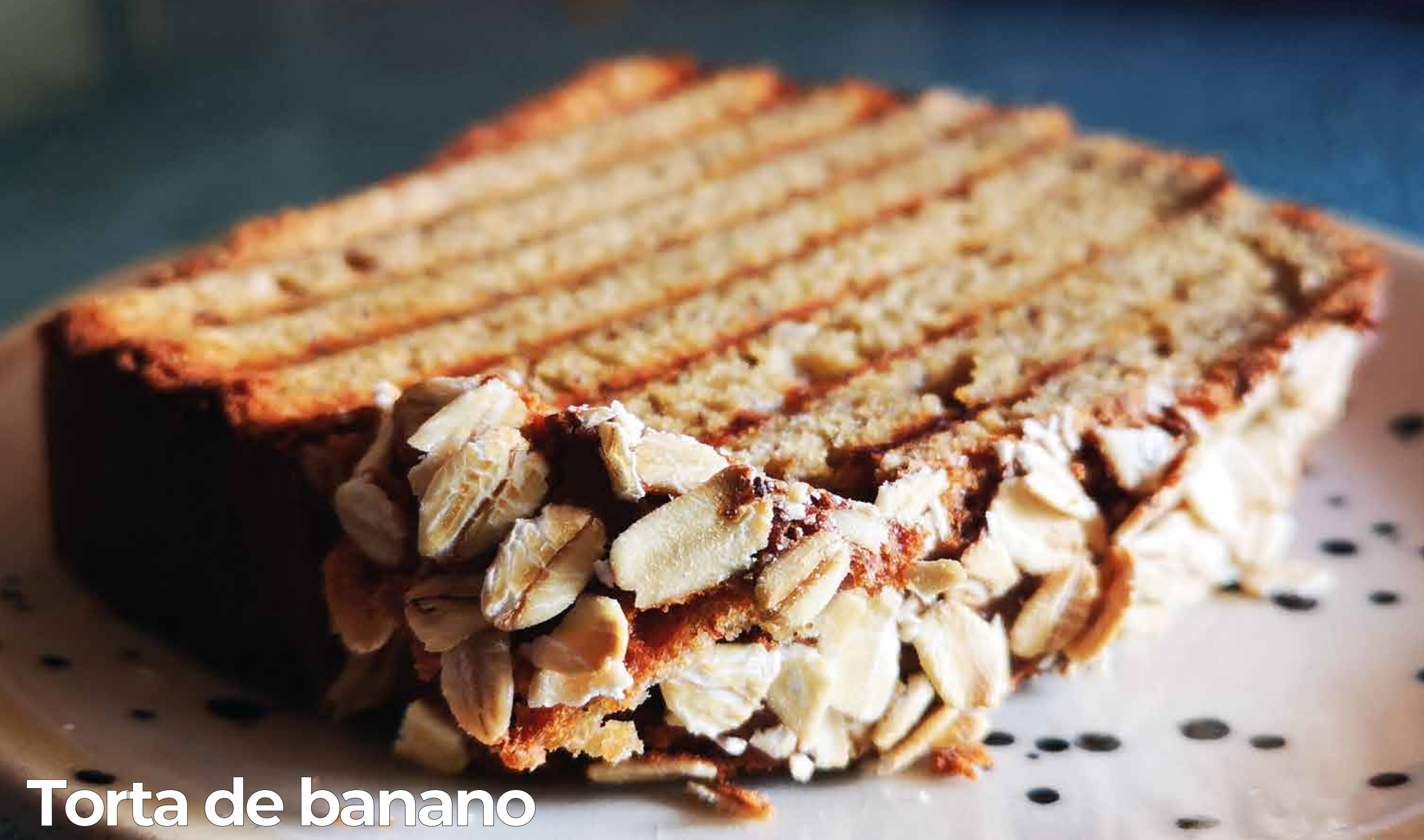
Torta de banana